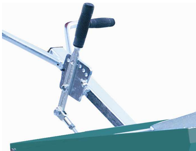
Rys. nr 2